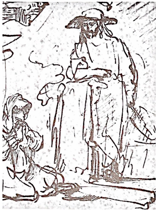
De opgestane Heiland verschijnt aan Maria Magdalena, door Rembrandt afgebeeld als tuinman met hoed en schop (Rijksprentenkabinet, Amsterdam).

Wat leert de Schrift zelf ons over haar woordelijke inspiratie? Zij maakt ons volkomen duidelijk dat niet slechts haar inhoud (haar boodschap, haar ke-